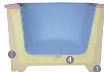
struktur Wannenträger System: direkt aufgeschäumter Weich- und Hartschaumstoff

Der struktur Hartschaumstoff (1) gibt Ihrer Wanne den richtigen Halt. Aus dem formstabilen Polyurethan lassen sich zudem alle nur erdenklichen Formen von Zusatzelementen wie Stufen oder Ecklösungen anfertigen (siehe unten).