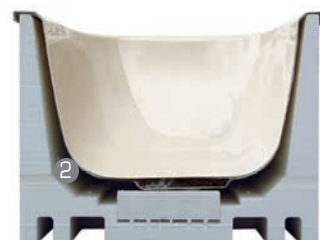
Problemzonen bei herkömmlichen Systemen: Hohlraum zwischen Träger und Wanne